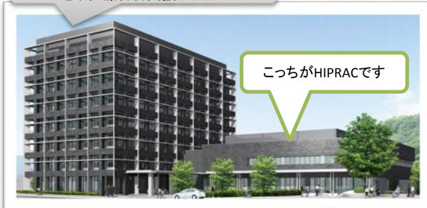
広島県医師会 地域医療総合支援センター

次回号からはHIPRACに整備されている放射線治療機器の紹介、HIPRACで行う放射線治療内容など丁寧にお伝えして行きます。